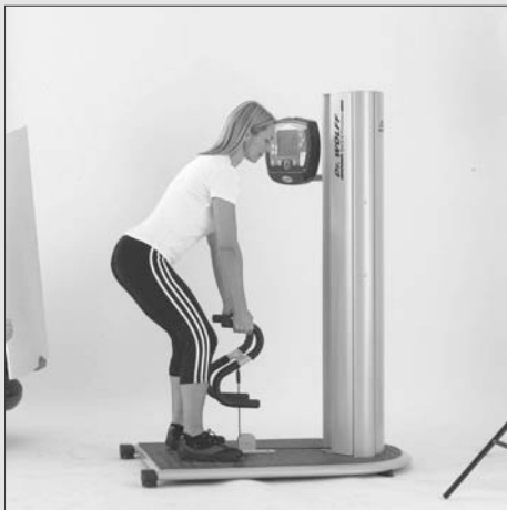
Heben und Tragen von Lasten als komplexe Alltagsbewegung